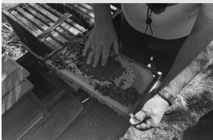
Bienenkönigin auf der Hand