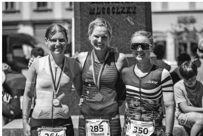
ersten 3 Frauen Gesamteinlauf

Stolz kann die SG-Niederwangen auf die Entwicklung der Triathlon Abteilung sein was das Ergebnis einer gezielten Förderung darstellt. Am nächsten großen Event zum 37. Ravensburger Triathlon am 6. August 2022 werden derzeit weit über 50 Starter von klein bis groß für unseren Heimatverein starten.