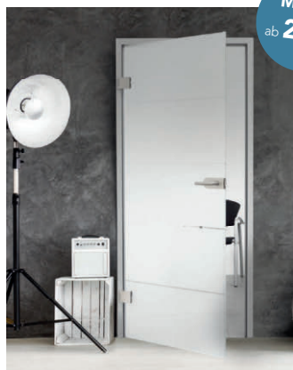
SPRINZ Ganzglasinnentür 1-farbiger Siebdruck inkl. Beschlag