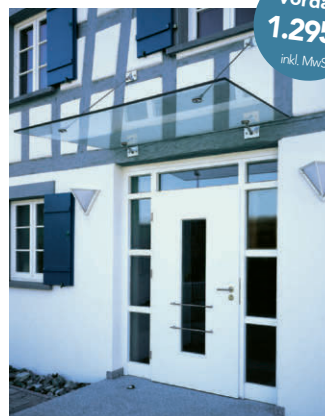
SPRINZ Punktgehaltenes Vordach 2.100 x 1.250 mm ohne Montage