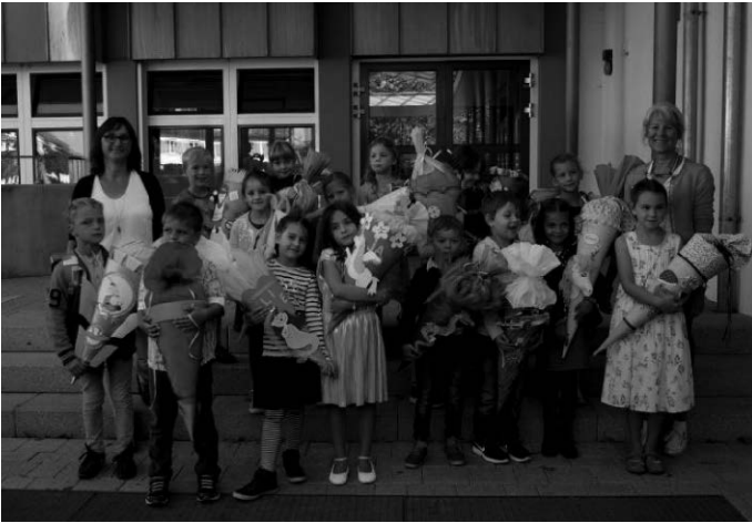
Ein HERZLICHES WILLKOMMEN an unsere Erstklässler und alles Gute für ihre Schullaufbahn. GWRS Niederwangen