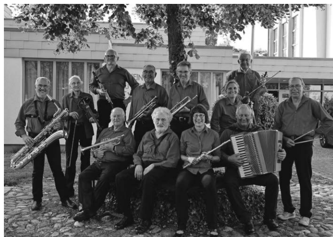
Die Wangener Saloniker.

Weitere Termine sind der 14. März, 11. April und der 50. Tanzkaffee mit Jubiläumsprogramm am 16. Mai.