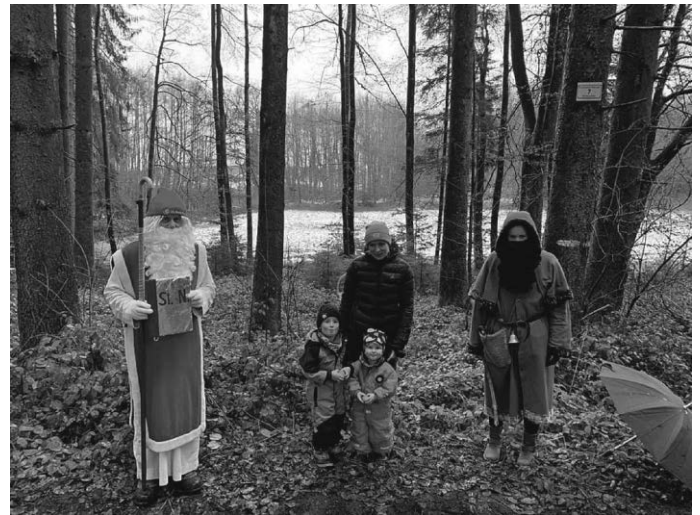
Vielen Kinder hatten so richtig Spaß mit dem SGN Nikolaus und seinem Ruprecht