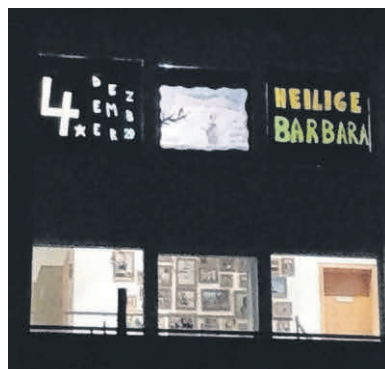
Adventsfenster Familie Alge