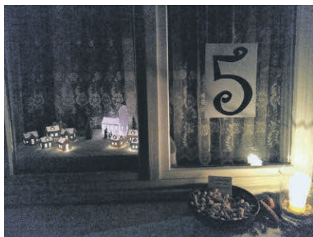
Adventsfenster 5 Familie Zwick