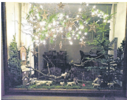
Adventsfenster 1 Gasthaus Krone