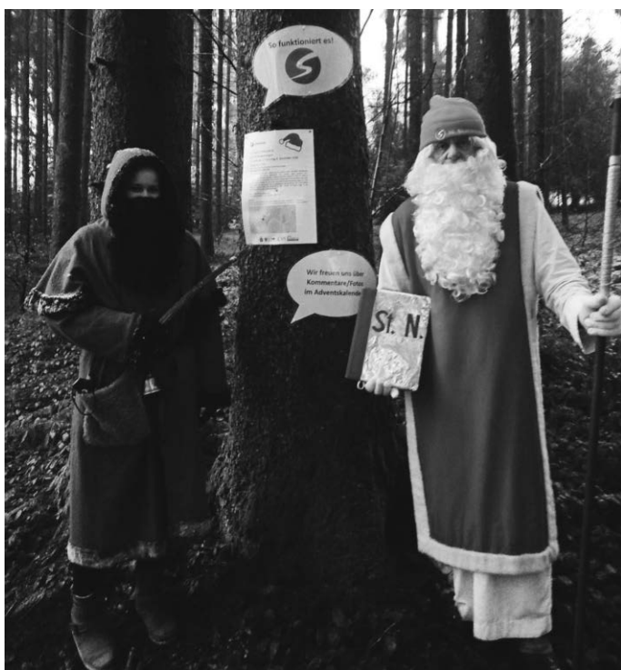
Nikolaus und Ruprecht waren gerne auch dabei