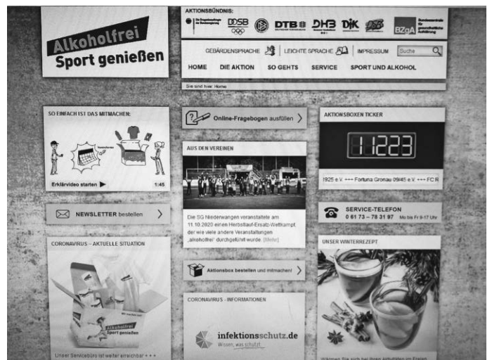
SGN bundesweit auf der Titelseite