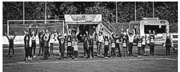
Ein Sporttag unter dem Motto 1 alkoholfrei Sport genießen „