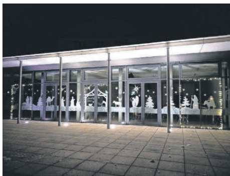
Adventsfenster 2 GWRS Niederwangen

Bei einem schönen Abendspaziergang kann man wunderbar dekorierte Fenster bestaunen. Alle Fenster sind auch auf unserer Homepage www.niederwangen.de zu finden. Ein herzliches Dankeschön für das Fotografieren aller Fenster an Andreas Klotz.