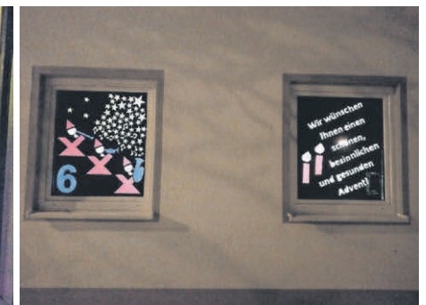
Adventsfenster 6 Musikverein