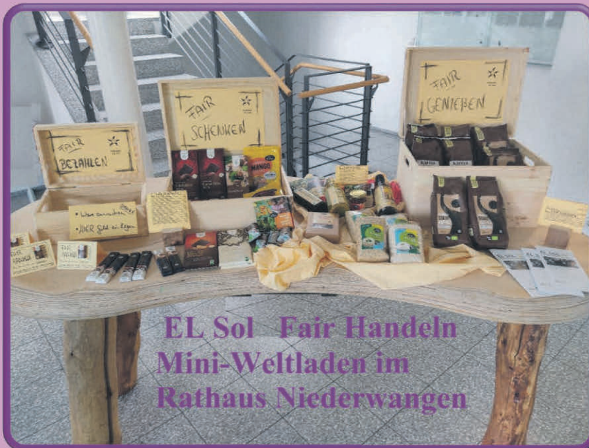
EL Sol Fair Handeln Mini-Weltladen im Rathaus Niederwangen

Seit dieser Woche müssen Sie nicht mehr nach Wangen fahren um im El Sol Weltladen Produkte zum Schenken, Kochen oder einfach nur Genießen zu kaufen. Im Foyer des Rathauses finden Sie eine kleine Produktauswahl.