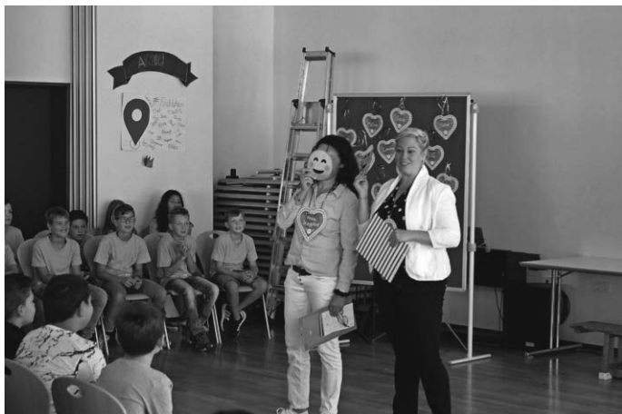
Lehrerinnen Kl. 5