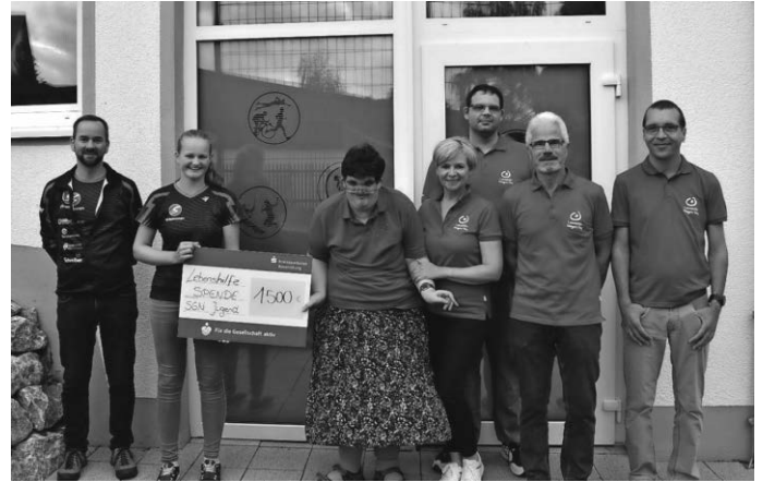
Spendenscheckübergabe der SGN-Jugend an die Lebenshilfe Württembergisches Allgäu - Wangen

Weitere Infos findet ihr auf www.sg-niederwangen.de