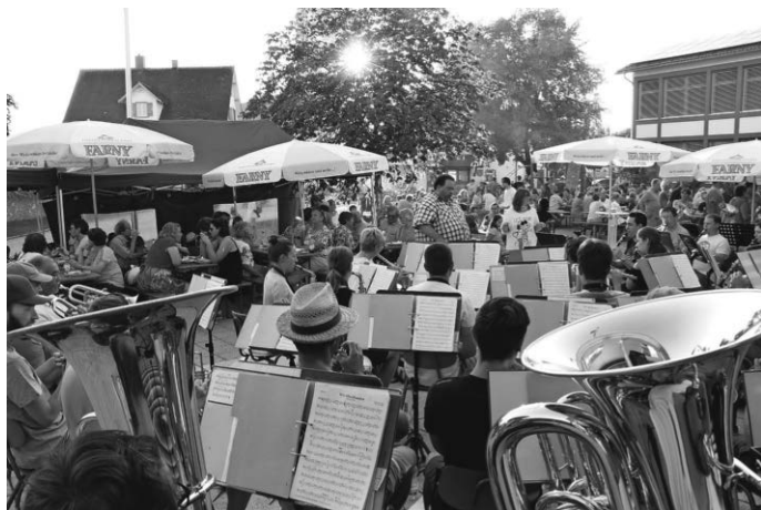
Die Musikkapelle Niederwangen beim letztjährigen Dorfplatzhock.

und die Gäste unterhalten. Im Anschluss daran wird die Musikkapelle aufspielen und mit gemischtem Musikprogramm für Stimmung auf dem Dorfplatz sorgen. Die Veranstaltung findet nur bei schönem Wetter statt, bei Regen entfällt der Dorfhock. Wir freuen uns auf einen schönen Abend mit Ihnen. Ihre Musikkapelle Niederwangen e.V.