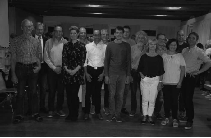
Ortschaftsräte neu und alt