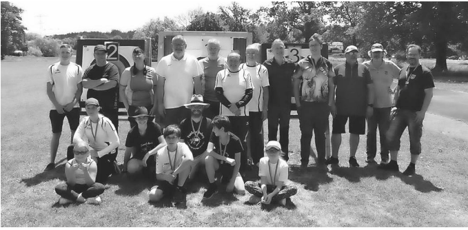
KMS am Samstag