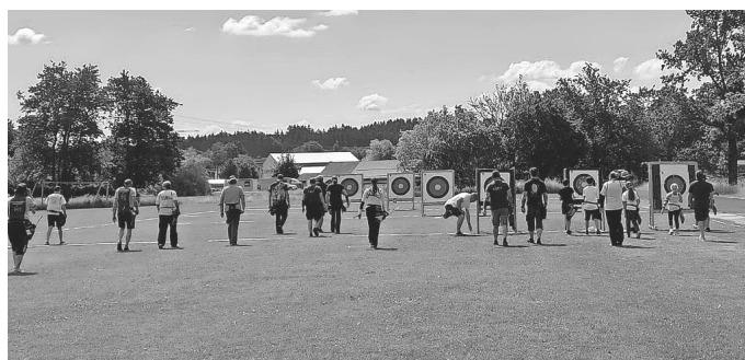
KMS am Freitag