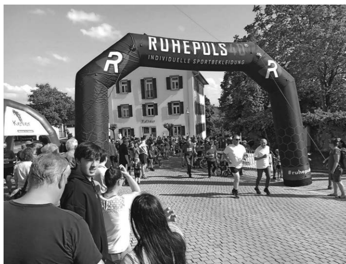
es war etwas besonderes