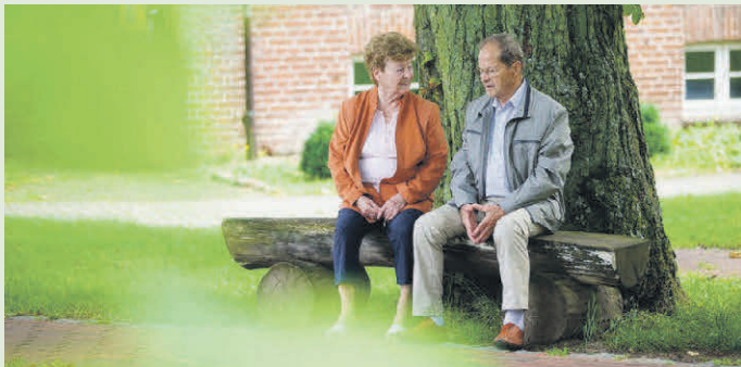
Die Menschen in Deutschland erfreuen sich an einer immer weiter steigenden Lebenserwartung. Die Kehrseite der Medaille: Ein langes Leben muss auch angemessen finanziert werden.