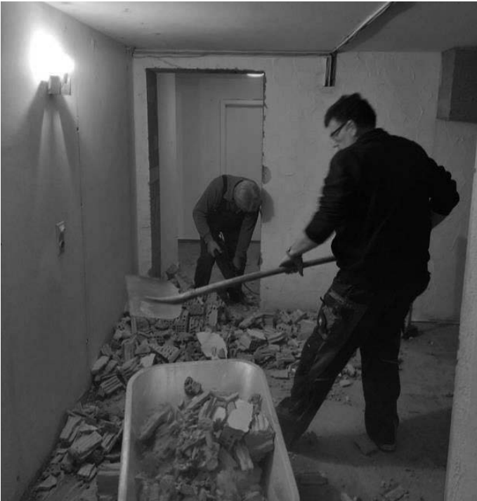
Der neue Notausgang wird durchgebrochen