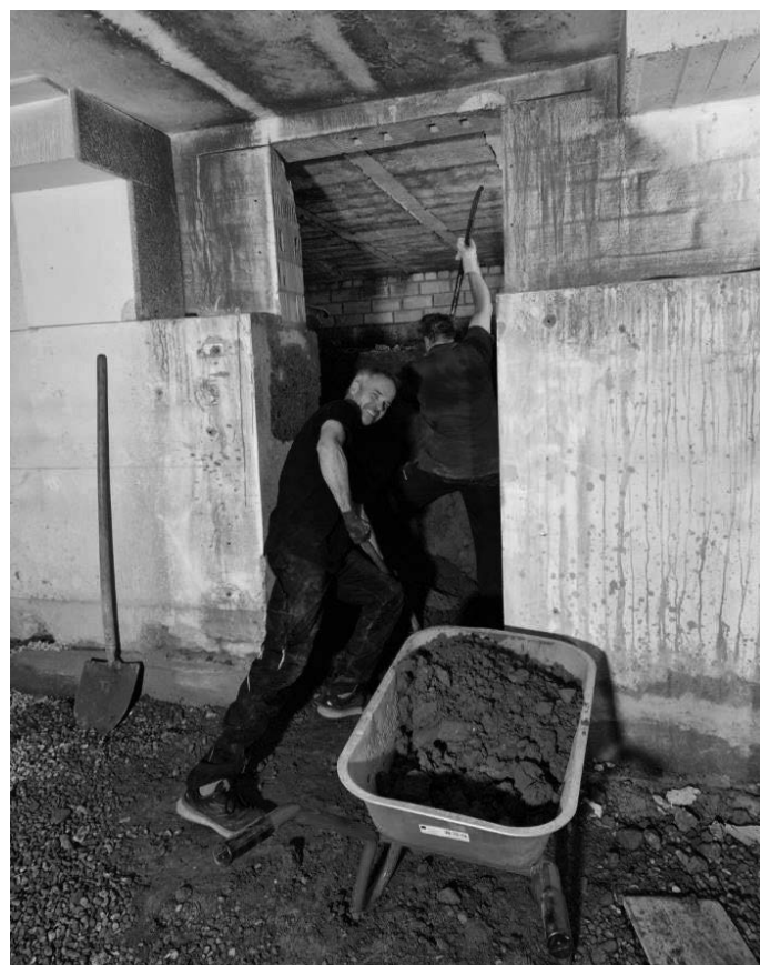
Die Arbeiten am neuen Lagerraum