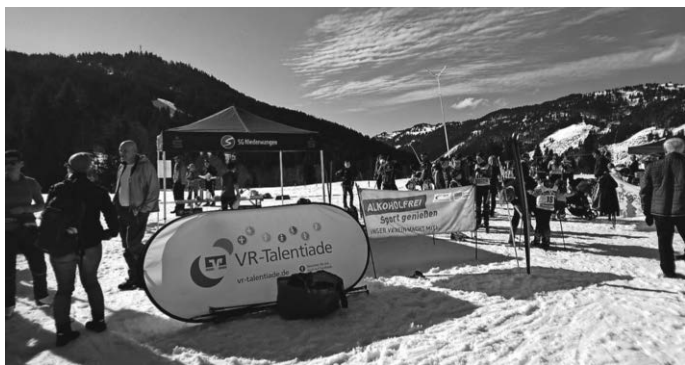
Kaiserwetter und tolle Bedingungen in Balderschwang

Die Ergebnislisten stehen auf der SGN Homepage unter www.sgn-niederwangen.de .