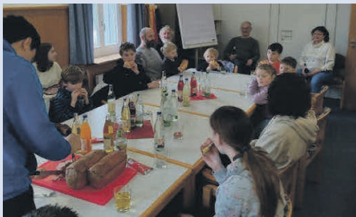
Verpflegung mit Leberkäs, Wecken und Getränken

Allen die dabei waren: ein herzliches Dankeschön!